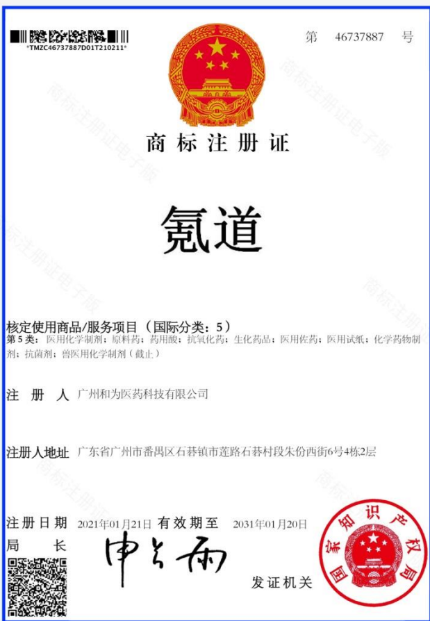
氮道商标注册证明