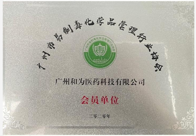
易制毒化学品管理行业协会会员单位