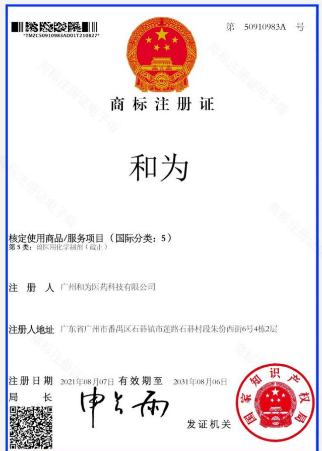
和为商标注册证明